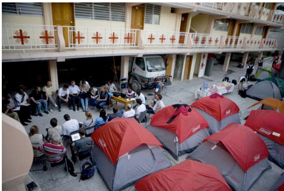
Reunión de coordinación de los equipos de Cáritas en la sede de Cáritas en Puerto Príncipe

Caritas ha establecido equipos de trabajo en los distintos sectores de intervención de la emergencia, en los que participan tanto el personal local de Cáritas Haití como los expertos enviados por Cáritas Internationalis. Cada equipo está involucrado en los clusters (comités de coordinación) respectivos de las Naciones Unidas sobre ayuda alimentaria, logística, agua y saneamiento, salud y vivienda.