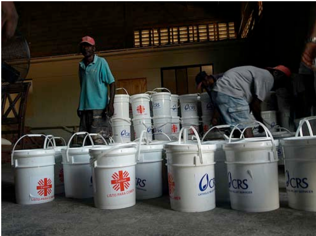
Preparación de lotes de productos higiénicos para su distribución.

Del fuerte terremoto de 6,1 grados en la escala de Richter que sacudió de nuevo a Haití el pasado 20 de enero oficialmente no se conocen víctimas. Únicamente se ha confirmado el derrumbe de edificios ya afectados por el terremoto del 12 de enero.