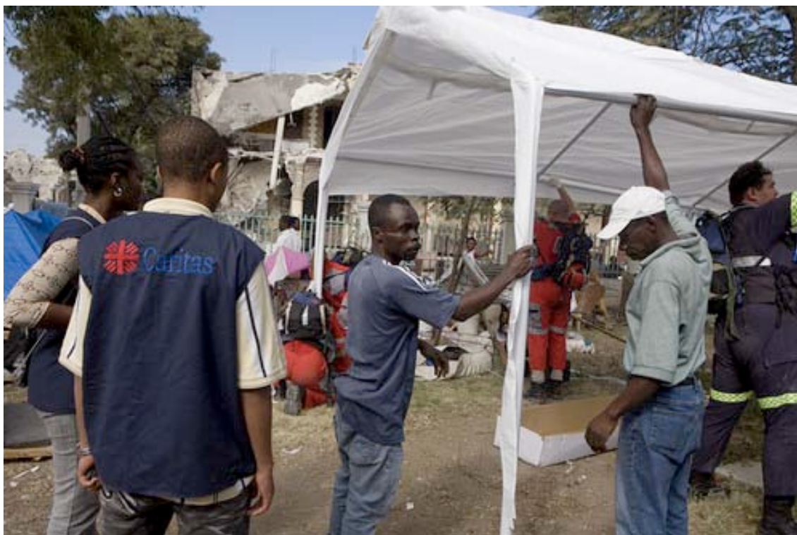
Instalación de una clínica de campaña en Léogâne.

Actualmente se trabaja en las provincias fronterizas con República Dominicana para promover programas de salud, acceso al agua potable y agricultura sostenible, a través de un convenio binacional financiado por la AECID. Asimismo, en noviembre de 2009 se inició un proyecto de agua y saneamiento en la provincia de Hinche (zona centro), que se suma a un programa de salud y microcrédito en todas las diócesis del país.