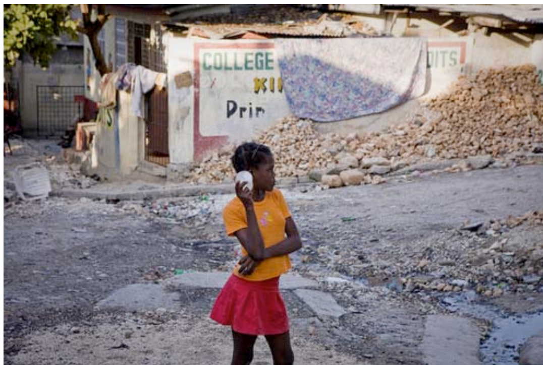
Una niña entre las ruinas del terremoto en Puerto Príncipe..

Además, se está negociando con Unión Europea la atención en la frontera haitiano-dominicana a los desplazados haitianos a través de un programa humanitario de seis meses de duración para proporcionarles alimentos, albergue temporal, productos de higiene, kits de cocina. Está previsto atender a