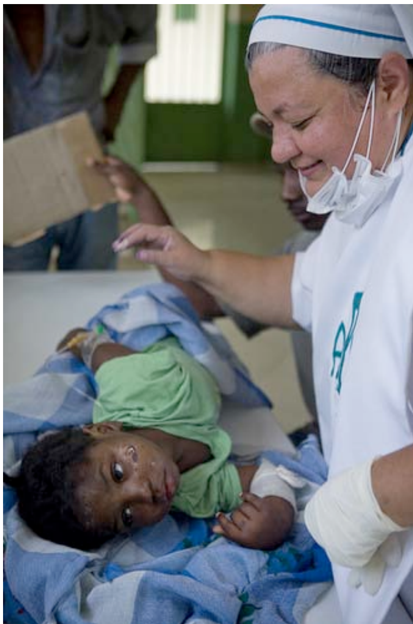
Una religiosa presta atención médica de urgencia a un niño.

Todos los miembros de Cáritas están siendo asignados para asumir las diversas funciones definidas en el llamamiento de ayuda ( Emergency Appeal , EA detallado en el punto siguiente) emitido el 20 de enero, con su correspondiente programa de respuesta. En este sentido, la red Caritas ha empezado ya a planificar la fase de recuperación y rehabilitación.