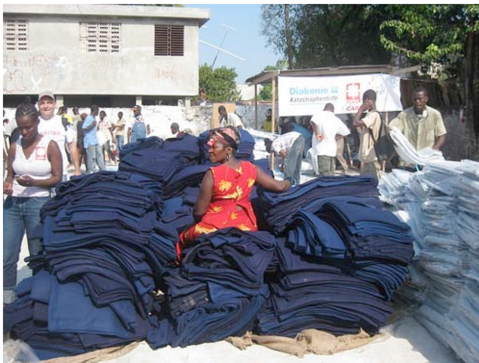
Operación de distribución de mantas a los damnificados.

En este sentido, se ha identificado una población de 200.000 beneficiarios de acuerdo a las realidades de la situación actual y valorando los logros alcanzados hasta la fecha y las limitaciones sobre el terreno. Caritas ha sido capaz de movilizar una gran cantidad de alimentos, kits de higiene, agua y materiales de emergencia para construir refugios de forma rápida y apoyar la rehabilitación de un hospital y 6 dispensarios.