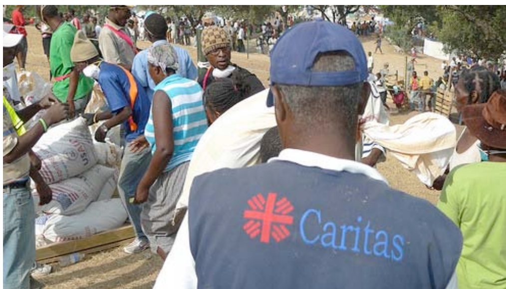
Distribución de ayuda alimentaria a los damnificados.

El aeropuerto está funcionando, aunque en la actualidad operan vuelos sólo relacionados con el terremoto. De todos modos, su capacidad es limitada a causa de las pocas reservas de combustible y los problemas de logística planteados por la gran afluencia de ayuda. Por su parte, el puerto marítimo de Puerto Príncipe está en condiciones para recibir de forma restringida cargamentos de ayuda después de las reparaciones realizadas para restablecer el tráfico de buques. Asimismo, las carreteras principales están transitables.