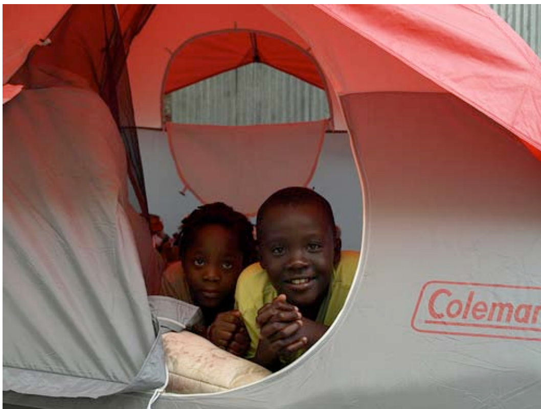
Un grupo de niños instalados en una de las tiendas distribuidas por Caritas.