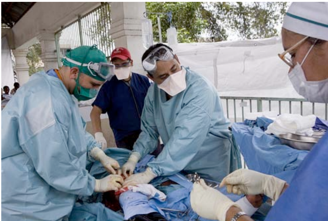
Un equipo médico de Cáritas durante una intervención quirúrgica de urgencia.

En este momento las necesidades más urgentes de los damnificados que se han identificado por parte de los expertos de Cáritas en el terreno son: