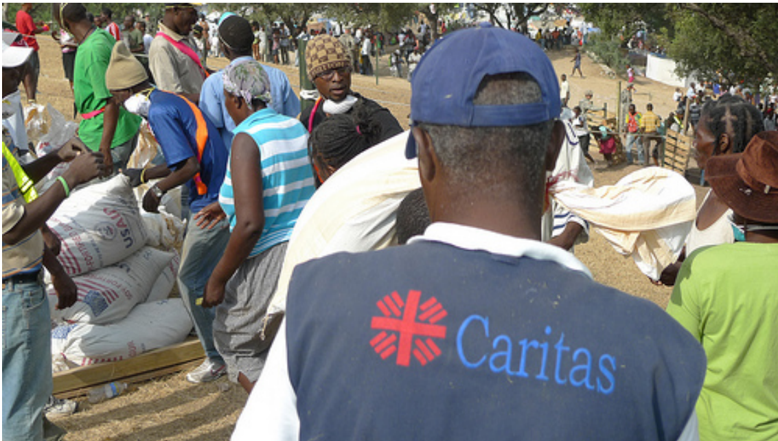
Reparto de ayuda humanitaria.

Asimismo, Cáritas Dominicana está ejerciendo un impagable papel como anfitriones de todos los miembros de la red internacional de Cáritas que se han desplazado a Haití a lo largo de este primer mes.