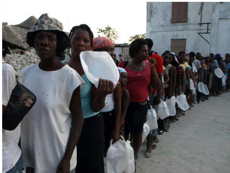
Un grupo de damnificados esperan el reparto de ayuda en un punto de distribución de Cáritas.

Por su parte, el puerto de Puerto Príncipe está en condiciones para recibir, de forma restringida, cargamentos de ayuda después de las reparaciones realizadas para restablecer el tráfico de buques. Asimismo, las carreteras principales están transitables.