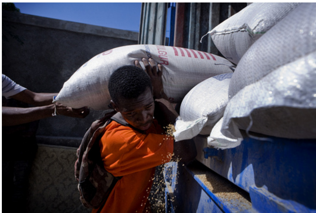
Distribución de ayuda alimentaria en Puerto Príncipe