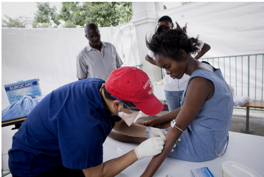
Un médico de Cáritas atiende a una de las víctimas del terremoto.

Asimismo, el Programa Mundial de Alimentos ha asignado a la red Cáritas tres zonas de distribución de alimentos en Puerto Príncipe: una que incluye las áreas del Champ de Mars y el palacio presidencial, otra que abarca el Golf Club de Petionville y una tercera, en la zona de Cazeau. En cada uno de estos sectores, Cáritas lleva a cabo operaciones de reparto de sacos de 25 Kg de arroz a las familias damnificadas.