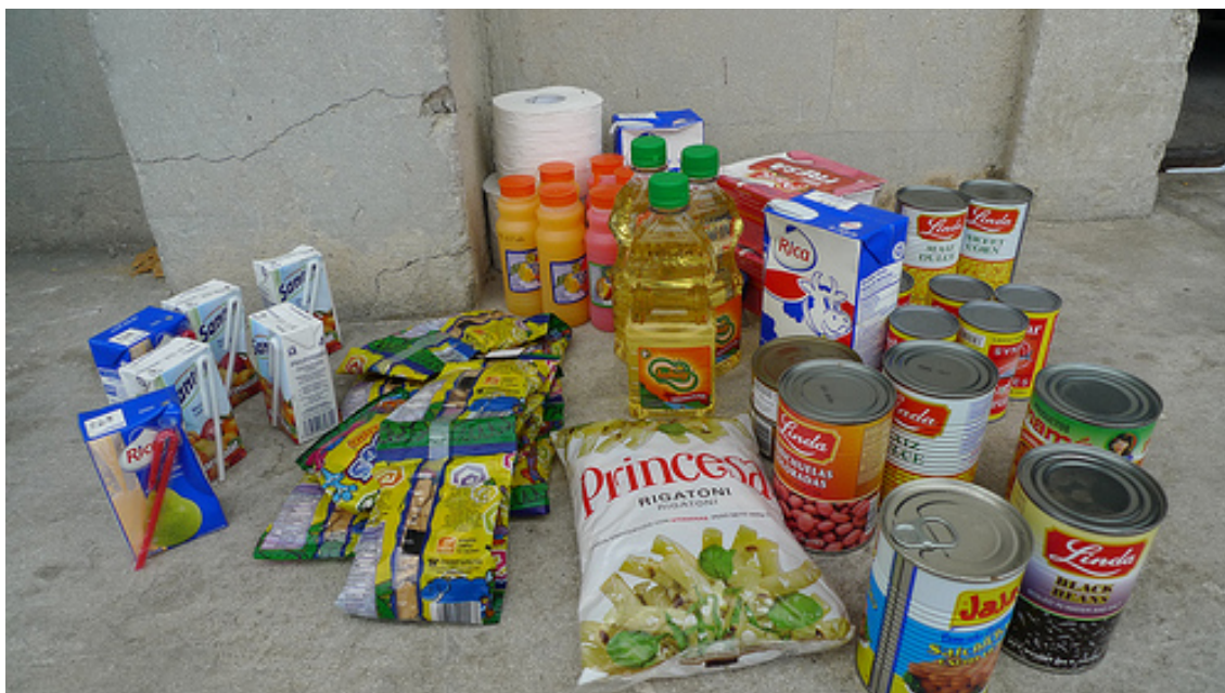
Uno de los lotes de alimentos que Cáritas distribuye en Haití.

Todos los miembros de Cáritas están siendo asignados para asumir las diversas funciones definidas en el llamamiento de ayuda ( Emergency Appeal , EA detallado en el punto siguiente) emitido el 20 de enero, con su correspondiente programa de respuesta. En este sentido, la red Caritas ha empezado ya a planificar la fase de recuperación y rehabilitación.