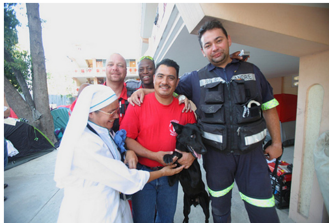
Uno de los equipos de rescate de Cáritas en la sede de Cáritas en Puerto Príncipe.

Caritas ha establecido equipos de trabajo en los distintos sectores de intervención de la emergencia, en los que participan tanto el personal local de Cáritas Haití como los expertos enviados por Cáritas Internationalis. Cada equipo está involucrado en los clusters (comités de coordinación) respectivos de las Naciones Unidas sobre ayuda alimentaria, logística, agua y saneamiento, salud y vivienda.