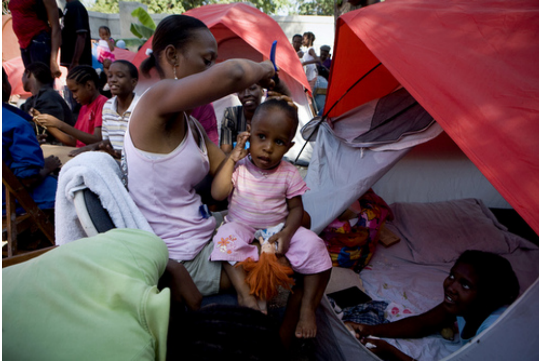
Una familia alojada en una de las tiendas de campaña distribuidas por Cáritas..

Caritas ha sido capaz de movilizar una gran cantidad de alimentos, kits de higiene, agua y materiales de emergencia para construir refugios de forma rápida y apoyar la rehabilitación de un hospital y 6 dispensarios.