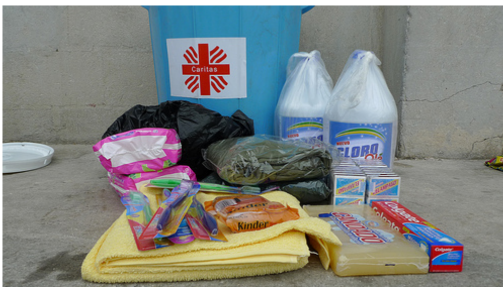
Lote de productos higiénicos que Cáritas está distribuyendo a los damnificados.

En esta ocasión, tanto la sede de los poderes ejecutivo y legislativo como los ministerios se derrumbaron e hizo necesario ubicar de forma provisional al Gobierno a una comisaría cercana al aeropuerto.