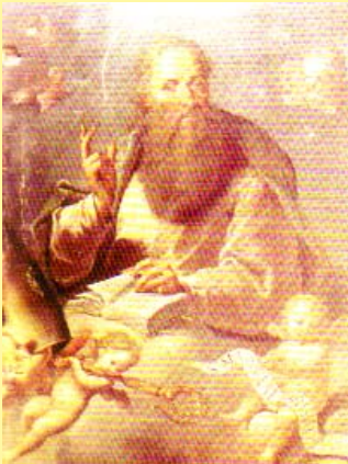
San Marcial Óleo sobre lienzo Juan de Miranda, siglo XVIII S.I. Catedral de Canarias

Creación del Obispado del Rubicón e inicio de la evangelización en las islas. El Catecismo normando. El traslado de la Diócesis y la fundación de la Catedral. La lucha por la libertad. Las devociones de castellanos y andaluces.