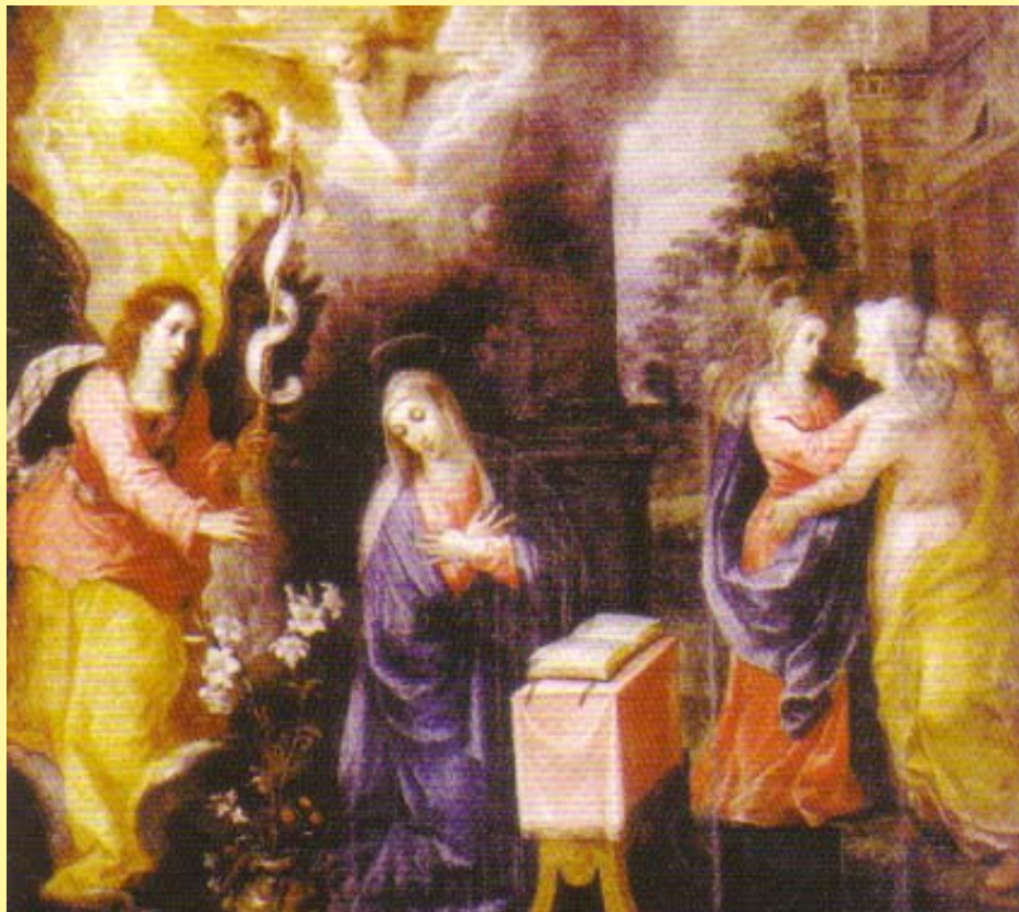
Anunciación y Visitación Óleo sobre tabla Hendrick Van Balen, siglo XVI S.I. Catedral de San Cristóbal de la Laguna La Laguna. Tenerife

Los momentos más importantes de la Historia de la Salvación: De la Anunciación a la Resurrección.