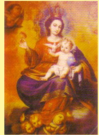
Nuestra Señora de San Salvador Óleo sobre lienzo Anónimo andaluz, siglo XVII Templo Ecuménico El Salvador. San Bartolomé de Tirajana. Gran Canaria.